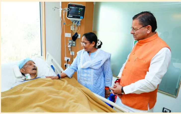
मुख्यमंत्री पुष्कर सिंह धामी ने मंगलवार को मैक्स अस्पताल, देहरादून में भर्ती पूर्व मुख्यमंत्री मेजर जनरल भुवन चंद्र खंडूड़ी (सेनि) की कुशलक्षेम जानी। मुख्यमंत्री ने चिकित्सकों से उनके स्वास्थ्य की जानकारी ली तथा उनके शीघ्र स्वास्थ्य लाभ की कामना की।