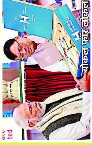
वोकल फॉर लोकल