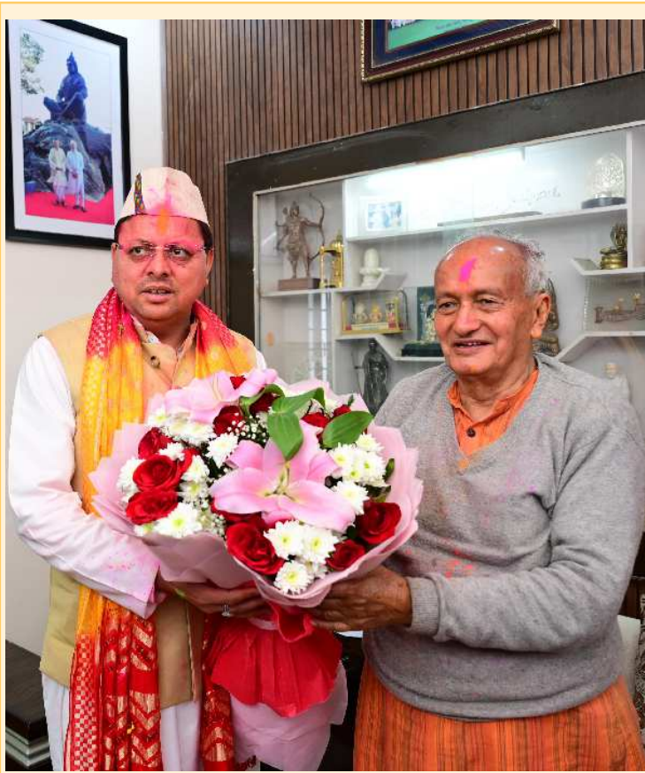
मुख्यमंत्री पुष्कर सिंह धामी ने गुरुवार को पूर्व मुख्यमंत्री एवं महाराष्ट्र के पूर्व राज्यपाल भगत सिंह कोश्यारी से देहरादून स्थित उनके आवास में मुलाकात कर होली की शुभकामनाएं दीं।

के हित में मुख्यमंत्री पुष्कर सिंह धामी के दिशा निर्देशन में उत्तराखंड में नया भू-कानून लागू किया गया है। सख्त भू-कानून लागू होने से अनियंत्रित भूमि खरीद और बिक्री पर रोक लगी है। मुख्यमंत्री के निर्देशों पर जिला प्रशासन इसमें पूरी सजगता से काम कर रहा है। तहसील ऋषिकेश अन्तर्गत 21.89 हे०, डोईवाला अन्तर्गत 2.82 हे०, तहसील सदर अन्तर्गत 68.84 हे०, विकासनगर अन्तर्गत 107.12 हे० भूमि उत्तराखण्ड उत्तरप्रदेश जमींदारी विनाश एवं भूमि व्यवस्था अधिनियम की धारा 154 के कुल प्रकरण अन्तर्गत कार्यवाही की गई है, जिनमें धारा के 393 मामलों में से 280 मामले पर कार्यवाही की गई तथा 166, 167 के अन्तर्गत कार्यवाही करते हुए 200 हेक्टेयर भूमि राज्य सरकार में निहित की गई।