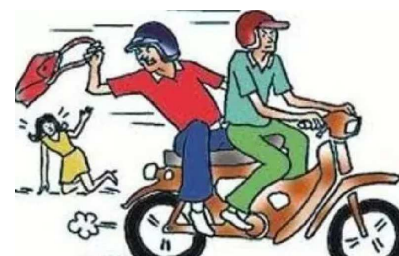
कराते हुए बताया कि वह बाजार से