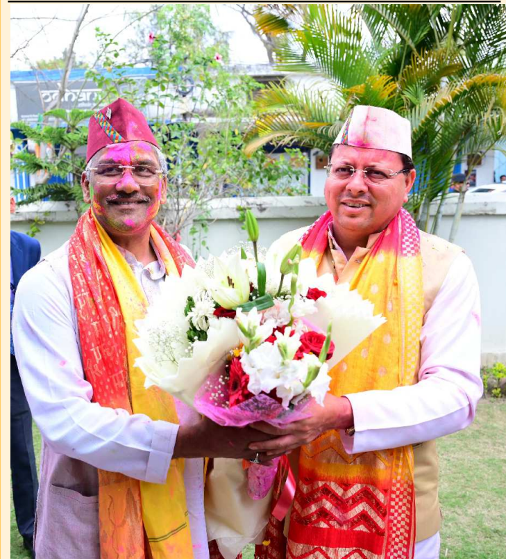
मुख्यमंत्री पुष्कर सिंह धामी ने गुरुवार को पूर्व मुख्यमंत्री एवं हरिद्वार सांसद त्रिवेन्द्र सिंह रावत से देहरादून स्थित उनके आवास में मुलाकात कर होली की शुभकामनाएं दीं।