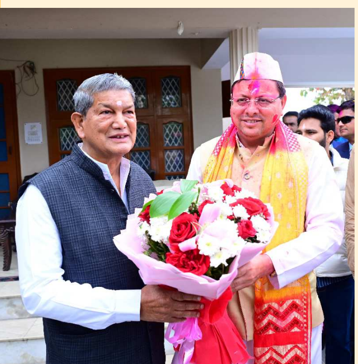
मुख्यमंत्री पुष्कर सिंह धामी ने गुरुवार को पूर्व मुख्यमंत्री हरीश रावत से देहरादून स्थित उनके आवास में मुलाकात कर होली की शुभकामनाएं दीं।