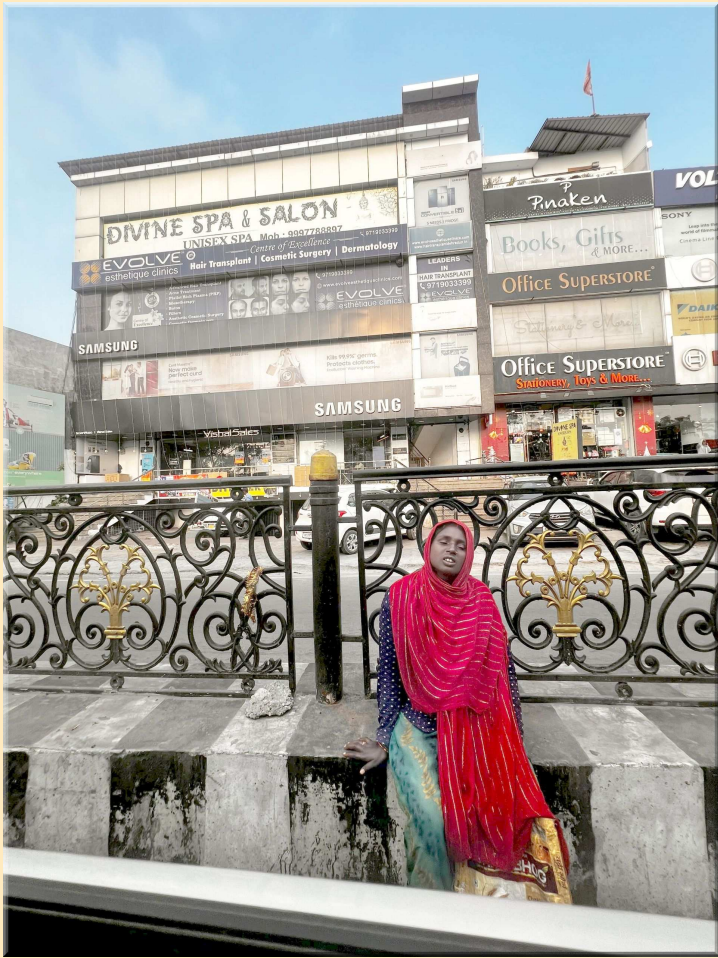
नहीं दिखेंगे भिखारी...।