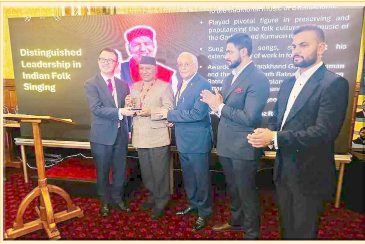
ब्रिटिश संसद के हाउस ऑफ लॉर्ड्स में सम्मानित किए गए प्रसिद्ध लोक गायक, गीतकार नरेंद्र सिंह नेगी।