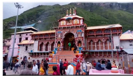
कपाट खुलने की तिथि घोषित की गई। बदरीनाथ धाम के कपाट खुलने की तिथि तय