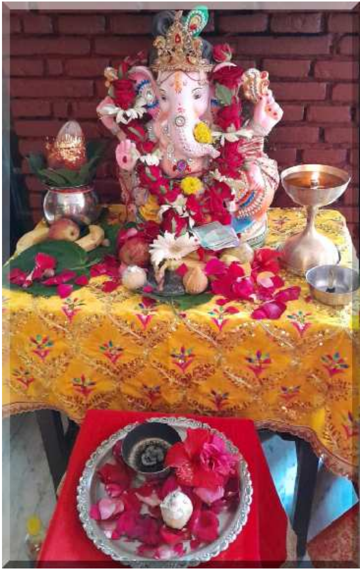
रिद्धि सिद्धि के दाता विघ्नहर्ता भगवान श्री गणेश सबको सुख शांति और समृद्धि प्रदान करें इसी मंगलकामना के साथ गणेश चतुर्थी की बधाई ।