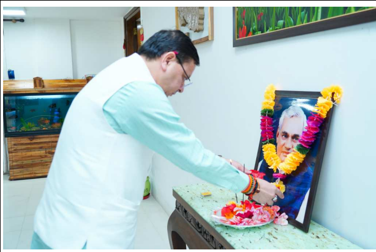
मुख्यमंत्री पुष्कर सिंह धामी ने पूर्व प्रधानमंत्री स्व. अटल बिहारी वाजपेई की पुण्य तिथि पर मुख्यमंत्री आवास में उनके चित्र पर पुष्पांजलि अर्पित कर श्रद्धांजलि दी।