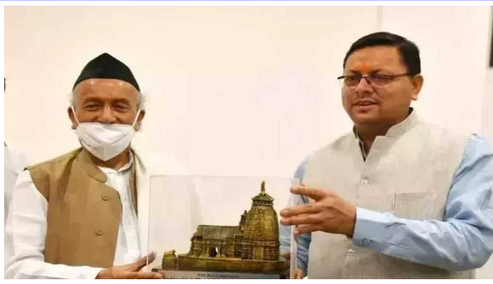
सीएम धामी ने दिल्ली में की राज्यपाल कोशारी से मुलाकात।