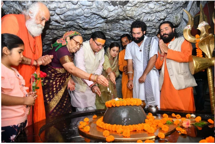
मुख्यमंत्री पुष्कर सिंह धामी ने टपकेश्वर महादेव मंदिर में जलाभिषेक कर भगवान शिव से प्रदेश एवं प्रदेशवासियों की सुख-समृद्धि की कामना की।