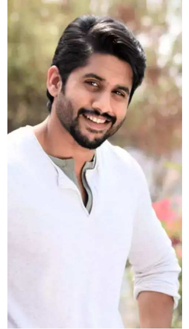
पूछताछ की गई।

नतीजतन, मेरी हिंदी में सुधार की जरूरत है। मैं बहुत लंबे समय से इसे लेकर असुरक्षित महसूस कर रहा हूँ। यही कारण है कि मैं हिंदी फिल्मों से दूर हो गया। नागा चैतन्य ने मीडिया के साथ खुलकर बातचीत की। उनकी डेटिंग अफवाहों के बारे में भी