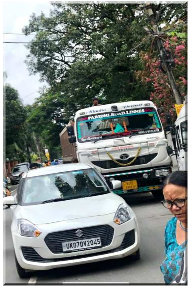
स्कूल टाईम (1 बजे) बलवीर रोड पर ट्रक की शहर में एंटी। ट्रैफिक पुलिस की कार्यप्रणाली पर प्रश्नचिह्न।

रात को ही पोस्टमार्टम करके दोनों कावड़ियों के शव परिजनों के सुपुर्द कर दिए गए हैं जबकि घायलों का उपचार किया जा रहा है।