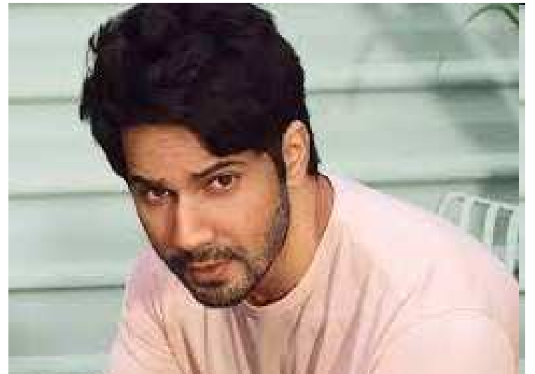
स्टूडेंट्स ऑफ द इयर से बॉलीवुड में डेब्यू किया था। इसके बाद वह हंप्टी शर्मा की दुल्हनिया, मैं तेरा हीरो और जुड़वा जैसी दमदार एंटरटेनर फिल्मों में दिखाई दिए थे। उन्होंने बदलापुर और अक्टूबर जैसी फिल्मों भी चुनीं।

वरुण ने कहा, खासकर कोरोना महामारी के बाद कोई नहीं जानता कि अब किस तरह की फिल्में चलेंगी। वहीं, अपनी व्यक्तिगत पसंद के बारे में बात करते हुए वरुण ने कहा कि उन्हें फैमिली एंटरटेनर पसंद है। बता दें कि वरुण ने