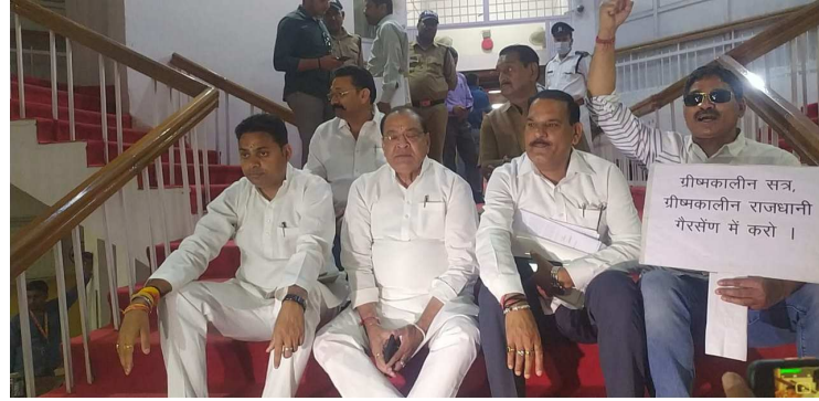
विशेष संवाददाता देहरादून। अपेक्षानुसार आज उत्तराखंड