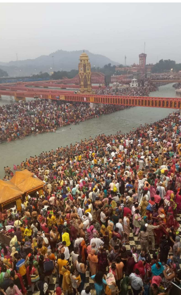
सोमवती अमावस्या पर हरिद्वार में उमड़ा जनसैलाब दोपहर तक बीस लाख लोगों ने किया स्नान

हरिद्वार। सोमवती अमावस्या पर आज हरिद्वार और ऋषिकेश में भारी जन सैलाब उमड़ता दिखा। हरिद्वार की हरकी पैड़ी सहित सभी घाटों पर श्रद्धालुओं की भारी भीड़ देखी गयी। सुबह से ही श्रद्धालुओं ने गंगा में स्नान शुरू कर दिया था दोपहर तक 15 से 20 लाख श्रद्धालु गंगा स्नान कर चुके थे। उम्मीद जताई गई है कि शाम तक 35 से 40 लाख के बीच श्रद्धालु स्नान करेंगे।