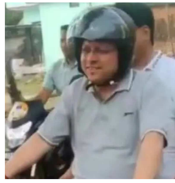
सीएम धामी मोटरसाइकिल से निकले जनसंपर्क अभियान पर

बनबसा। चंपावत उपचुनाव के लिए भले ही चुनाव प्रचार अभियान थम चुका हो लेकिन जनसंपर्क अभियान जारी है। मुख्यमंत्री धामी ने चुनाव प्रचार के अंतिम दिन धुआंधार प्रचार किया और अब वह मोटरसाइकिल पर सवार होकर समर्थकों के साथ डोर टू डोर जनसंपर्क अभियान में जुटे हैं।