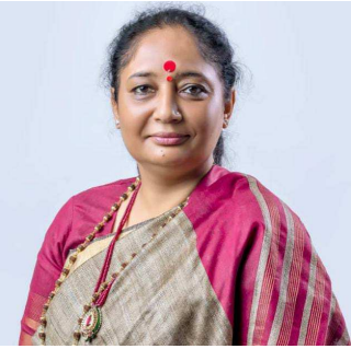
संविधान एवं महिलाओं के अधिकार विषय पर रखेंगी विचार

देहरादून। विधानसभा अध्यक्ष ऋतु खंडूडी भूषण केरल की विधानसभा में आयोजित होने वाले दो दिवसीय महिला विधायक सम्मेलन में भाग लेकर संविधान एवं महिलाओं के अधिकार विषय पर अपने विचार रखेंगी।