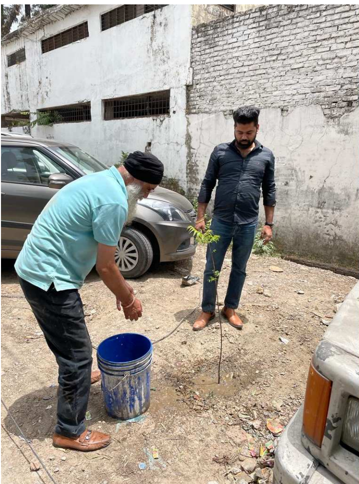
पटेल नगर इंडस्ट्रियल एरिया में किया नीम का पौधारोपण।