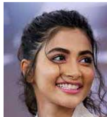
उनके एक प्रशंसक ने पिछले बुधवार को हैदराबाद के एक थिएटर में कहा, अगर

विजय की मुख्य भूमिका में, नेल्सन दिलीपकुमार के निर्देशन में पूजा की भूमिका दर्शकों को निराशाजनक लगती है।