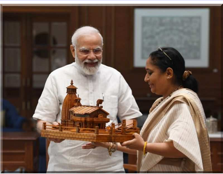
उत्तराखंड विधानसभा अध्यक्ष ऋतु खंडूरी भूषण ने प्रधानमंत्री नरेंद्र मोदी से की शिष्टाचार भेंट।