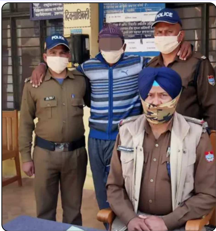
अल्मोड़ा: 'मित्र पुलिस' के कथे पर अपराधी का हाथ।